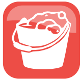
UMIDA / WET

Ordinary dry cleaning is most frequent and it can be done daily to remove dust and any kind of abrasive agent, as sand, small pebbles and hair.