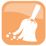
SECCO / DRY

In general, ordinary cleaning is divided into ordinary dry cleaning and ordinary wet cleaning .